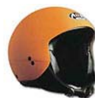
Jet senza visiera

2. Non risparmiate troppo: al di sotto dei 125/150 euro un casco integrale non può essere costruito con materiali di ottima qualità. Le calotte interne in polistirolo infatti sono sensibili all'umidità, dovuta all'ambiente o al nostro sudore, ed i caschi migliori adottano soluzioni che ne garantiscono meglio l'efficacia nel tempo. Non esiste tuttavia per il casco una data di scadenza, poichè un casco tenuto nella propria scatola all'asciutto non subisce alcun deperimento dei materiali, uno invece molto usato può deperirsi in un paio d'anni.